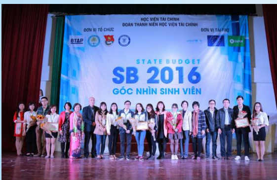
Ảnh: Ban tổ chức và các đội lọt vào vòng chung kết trong đêm chung kết cuộc thi SB 2016

Có thể nói, sau bước đầu gặp một số khó khăn trong việc lựa chọn và quyết định hình thức, chủ đề, cuộc thi đã thành công tốt đẹp và nhóm thực hiện cuộc thi của Liên minh đã thu lượm được nhiều kinh nghiệm hữu ích khi tổ chức những hoạt động hướng tới thanh niên. Hy vọng rằng trong thời gian tới, với những thành công bước đầu này, BTAP sẽ tiếp tục thành công trong những hoạt động về chủ đề NSNN hướng tới thanh niên.